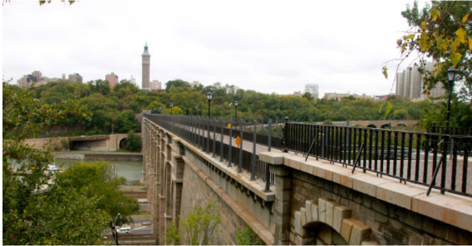
El Puente Alto que conecta Washington Heights con el Bronx.