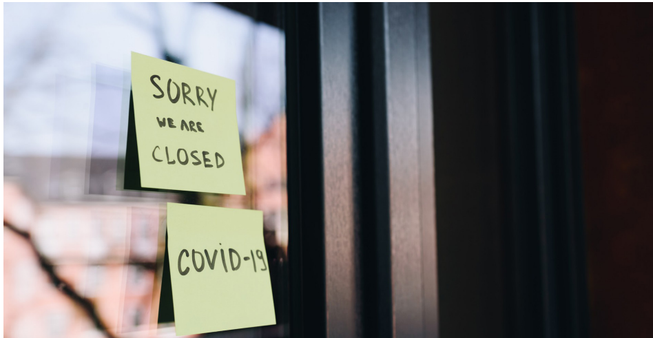
Foto: Negocio cerrado