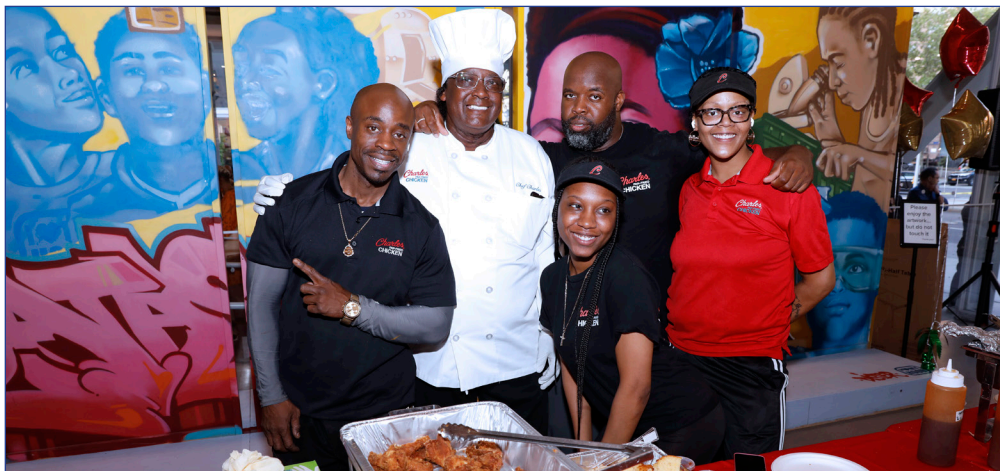
El sabor de Harlem 2023.