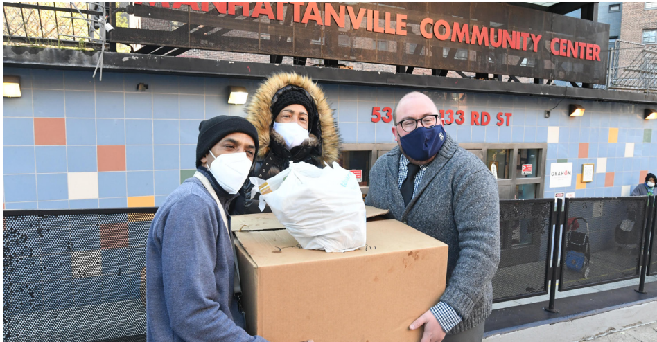
Empleados de CUFO entregan alimentos a adultos mayores en Manhattanville Community Center.