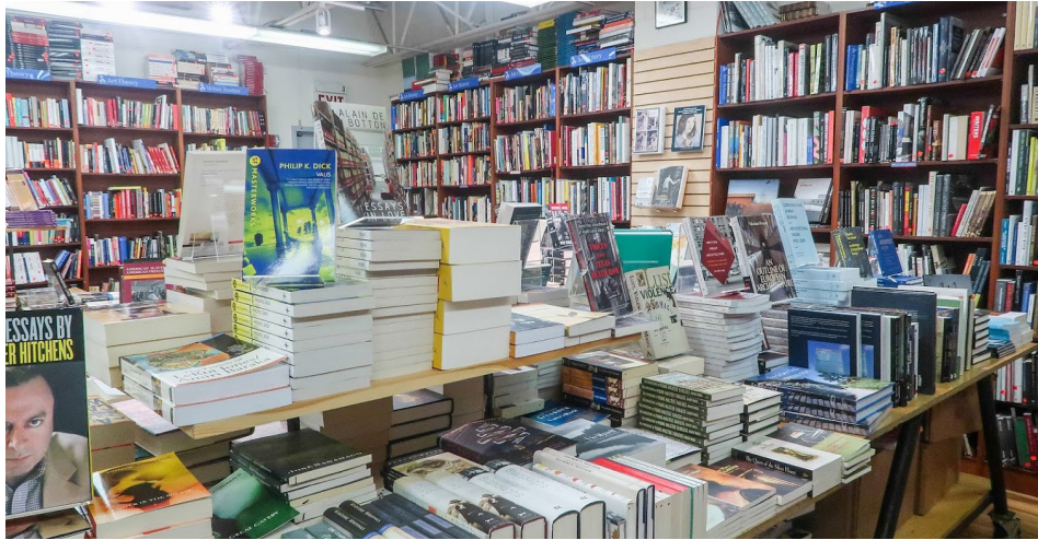
Inside Book Culture's W. 112th Street store.