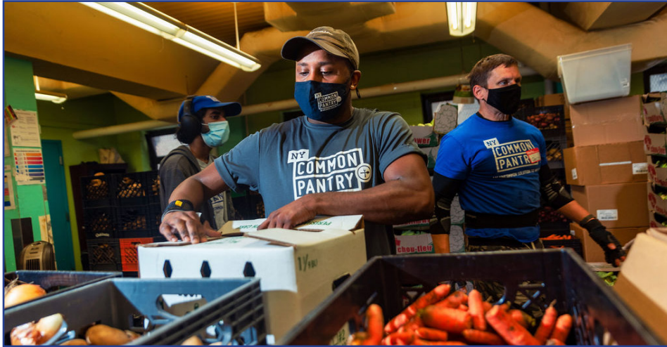
NYCP Pantry Packers at work.