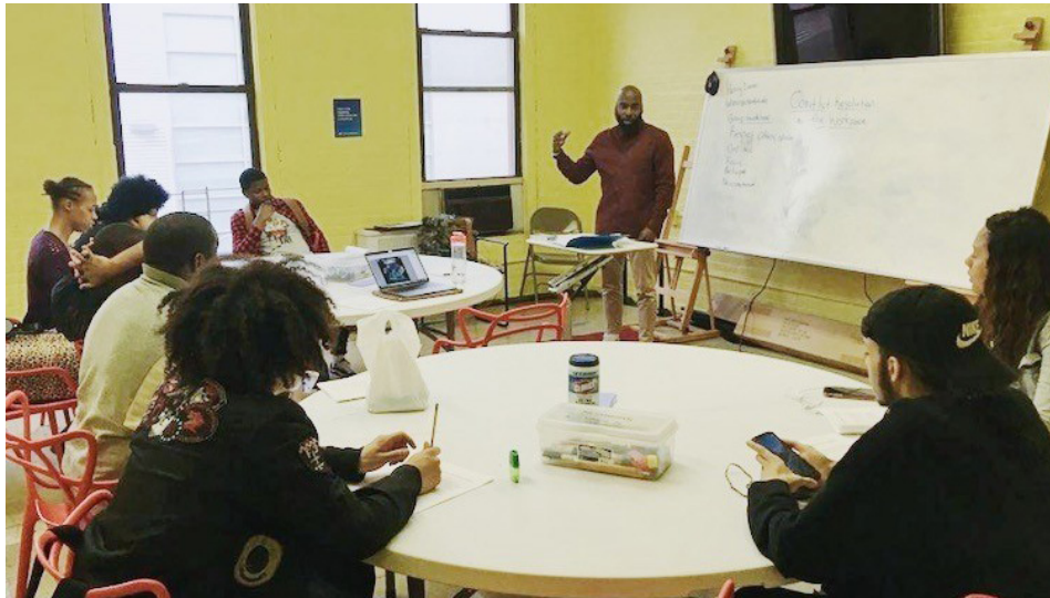
Foto: Taller de CYI sociedad con el Living Redemption Youth Opportunity Hub