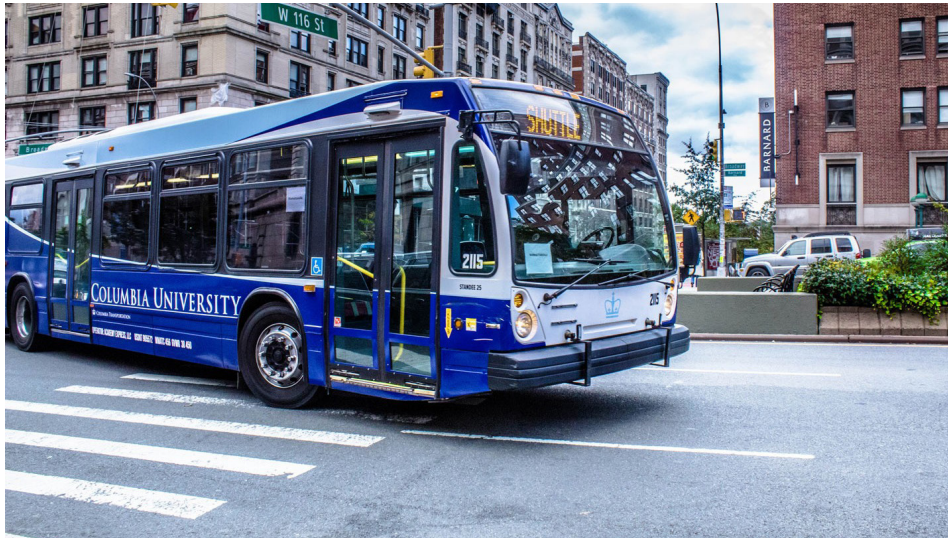
En la foto: Autobús de transporte de la Universidad de Columbia